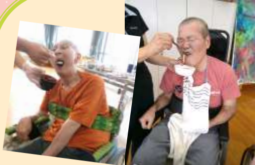
わんこそうめん何杯食べられるかな？