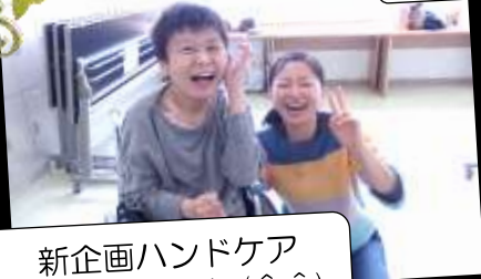
新企画ハンドケア 手がツルツルに(^^)

一月八日に、バーバリウムボールペンを、一月十一日には、干支のねずみキーホルダーのグルーテコをポラントピアさんのご指導のもと、作成しました、きれいな作品ができてごみなさん満悦！