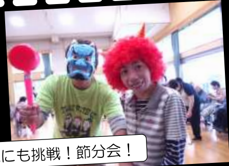
鬼にも挑戦！節分会！