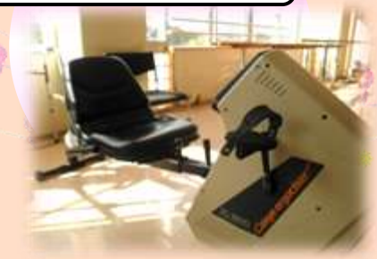
上肢を背もたれに預ける事ができるタイプ