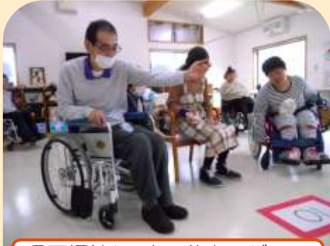
県西福祉センター的あてゲーム (食のイベント)