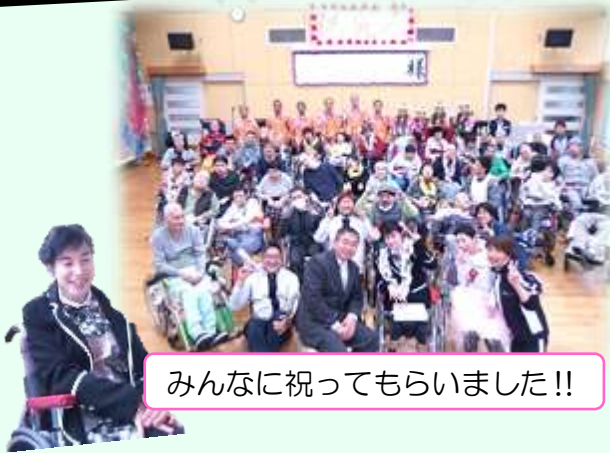
みんなに祝ってもらいました！！

一月十二日は、「成人を祝う会」が行われました。ポラントピアさんによるハワイアン演奏とフラダンスにはじまり、利用者さん、職員、たくさんの方にお祝いし、たい出に残る素敵な時間になったと思います。