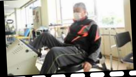
下肢に適度な負荷をかけて訓練