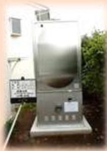
スプリンクラーポンプユニット

神奈川県障害福祉施設等施設整備費補助金を活用し、重度な方々が生活するあまつほホームに、スプリンクラーの設置を行いました。安心・安全なグループホームでの生活が、より一層向上、利用者、職員一同感謝しております。 工事名…水道連結型スプリンクラー設備一式 補助額…参百九万参千円