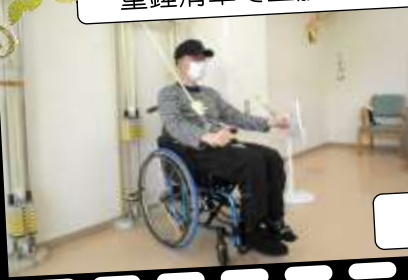
重錘滑車で上肢筋力維持