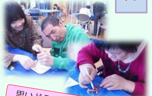
思いどおりにできるかな…？

一月二十五日にはアロマハンドケアが行われました。様々な香りのついたハンドオイルを使い、この季節乾燥してきた手をツルツルスベスベにして貰って気分もツルツル！ 二月二日は節分会。リズムカピアノ教室の子供達からの手話の歌とダンスをご披露いただき、豆まきへ。最初は三人しかいなかった鬼は、途中から増えたり、入れ替わったり！子供達も最後まで笑顔で一緒に楽しみました。