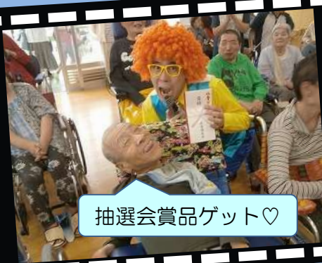
抽選会賞品ゲット♡