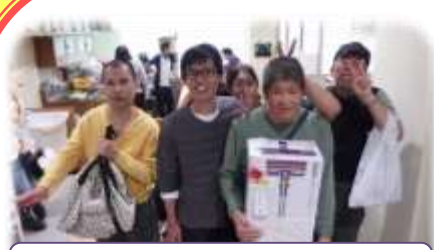
秋まつり！豪華景品ゲットだぜ♪

1月17日 新春運動 成人を祝う会 3月13日 ワクワクのりのり コンサート 18日 自分発表会