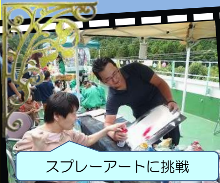
スプレーアートに挑戦