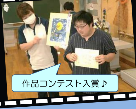
作品コンテスト入賞♪