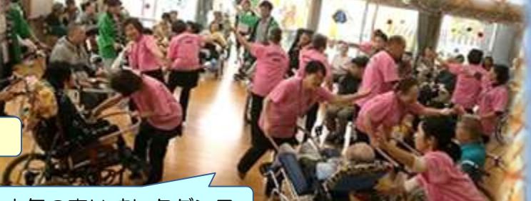
人気の車いすレクダンス