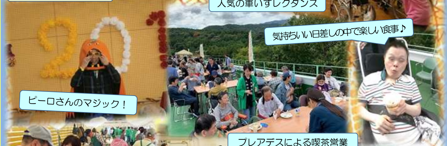
気持ちいい日差しの中で楽しい食事♪