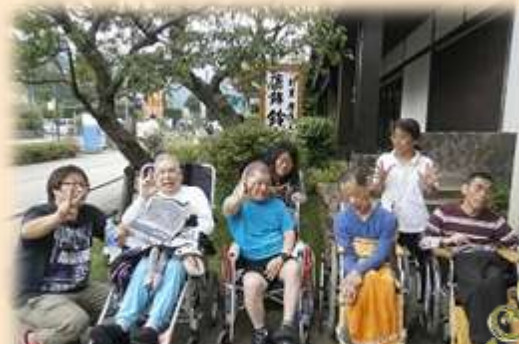
秋の外出♪ 鈴廣前で!!