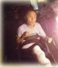
夜はみんなで花火!!