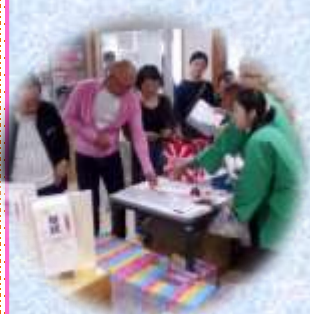
敬称は省略させていただきました。

上記以外にも多くの方々にご協力、ご支援を賜りましたこと、重ねて感謝申し上げます。