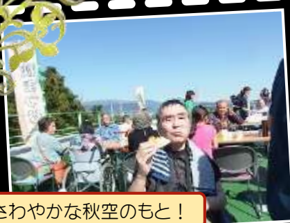
さわやかな秋空のもと！