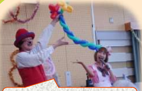
秋まつりのイベントは まりのんさん&ごっちゃん