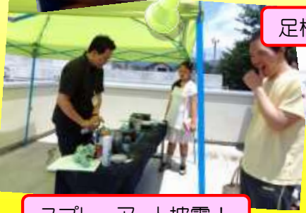
スプレーアート披露!