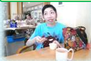
アイスを食べました♡