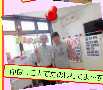
仲よし二人でたのしんでま〜す!!