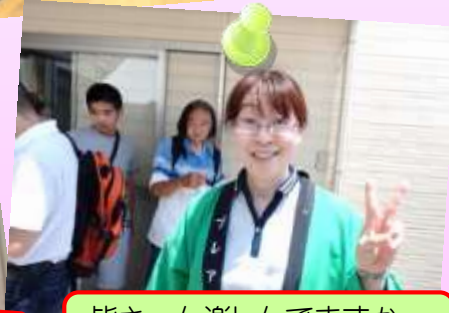
皆さ〜ん楽しんでますか〜古沢で〜す!