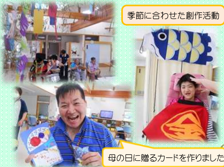
母の日に贈るカードを作りました!

また、静養やリクライニングをしたいなどの時のためにベッドをそれぞれに三床設置し、ストレッチ等を行う時の場合にも備えてマットも二組設置してあります。 利用者の皆さんが主に過ごすフロア内は、季節やイベントに沿った作品を利用者と支援員が一緒になって制作し、でき上がった物を飾り付けたり、秋まつりの作品コンテストにも出展させて頂いています。 このように、日々より変化していくのも、皆さんのご協賛あってのことだと思っております。これからも様々な催しものや活動を企画していきますので、ご支援のほどよろしくお願い致します。