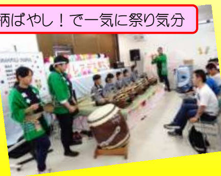
足柄ばやし! で一気に祭り気分