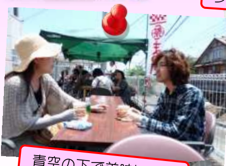
青空の下で美味しいな