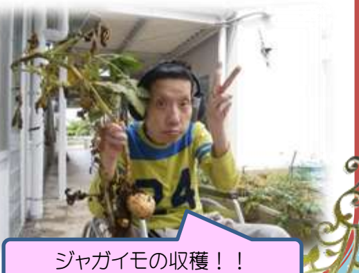
ジャガイモの収穫!!