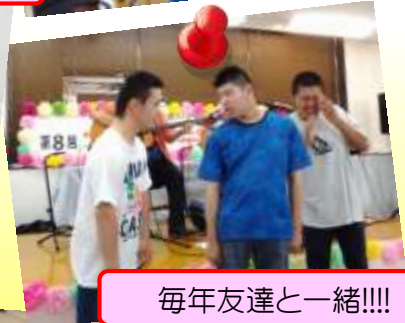
毎年友達と一緒に!!!!