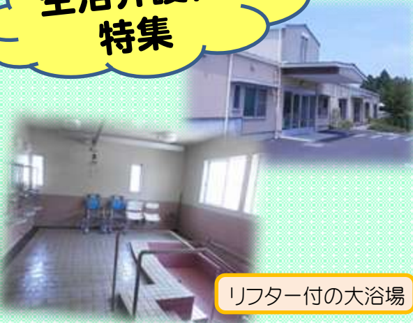
リフター付の大浴場