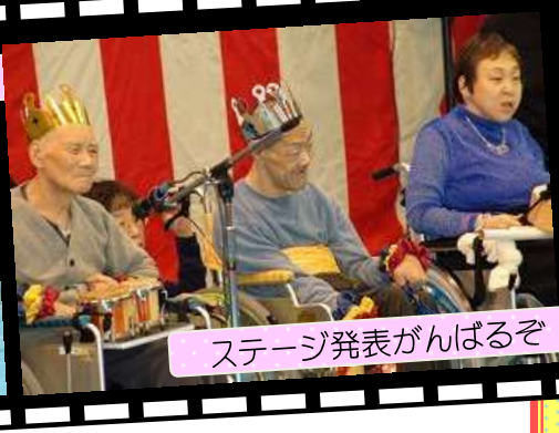
ステージ発表がんばるぞ