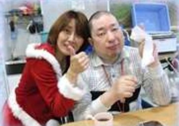
女子サンタと記念写真♪