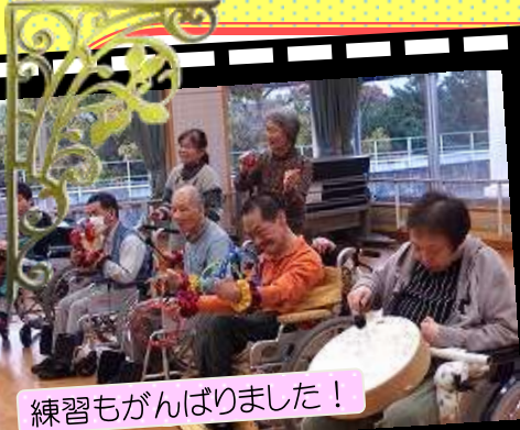
練習もがんばりました！