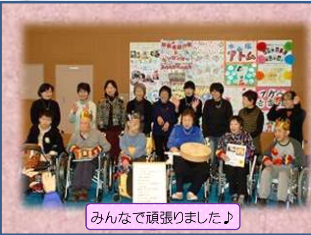
みんなで頑張りました♪

演奏終了後はステージ発表のサブテーマである「咲き誇る笑顔輝くステージ」のとおり、たくさん笑顔と満足そうな姿がとも印象的でした。