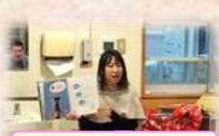
とんちゃんの絵本タイム

十一月下旬、ばんちょマンと仲間たちの皆さんによるギターと打楽器力ホンの初ライブ。利用者さんの無理難題なリクエストにも応えていただき、最後にはオリジナル曲の演奏もあり、笑い声と拍手が絶えない素敵な時間でした。