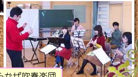
うらかぜ吹奏楽団