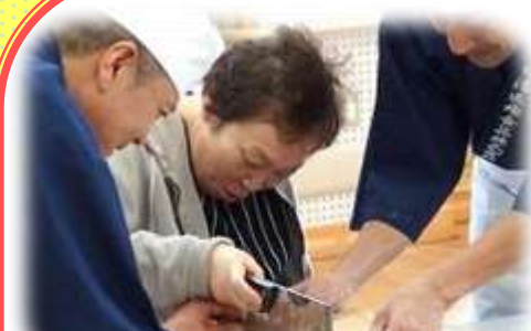
真剣にそば切り体験