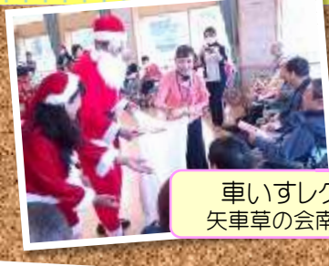
車いすレクダンス 矢車草の会南足柄支部