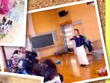
小田原奇術クラブ