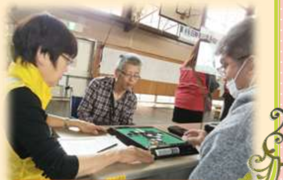
県の卓上大会で真剣勝負