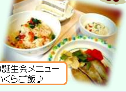
3月お誕生会メニュー いくらご飯♪