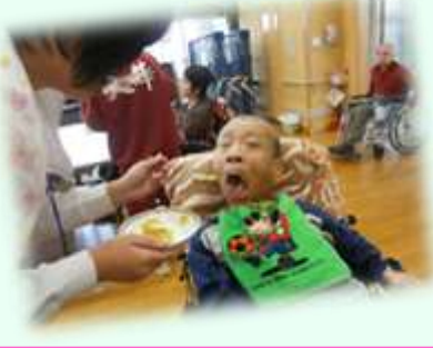
♪ 恵方巻き ♪