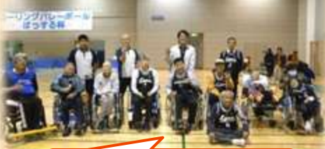
足柄リノクス、勢揃い！