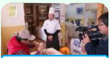
ケーブルテレビの取材

今年の七月で二年目を迎える「ふくらん」は、皆さまのご支援のもと、「こまごま」順調に推移しています。七月十八日から十八日に、三周年感謝セールの実施を予定しておりますので、どうぞよろしくお願いたします。