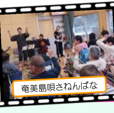
奄美島唄さねんばな