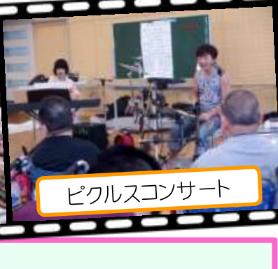
ピクルスコンサート